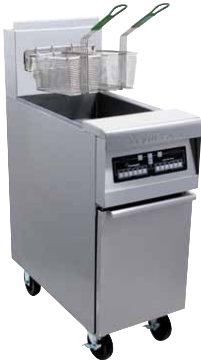
Modèle présenté avec roulettes et computer en option