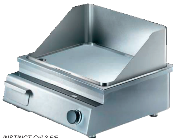
INSTINCT Gril 3.5/5