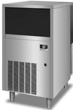
Model UNK-0200A Nugget Ice Machine