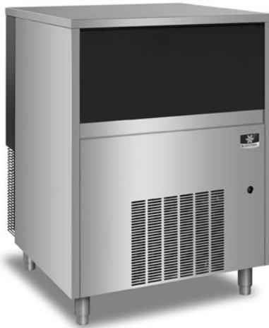
Model UNK-0300A Nugget Ice Machine