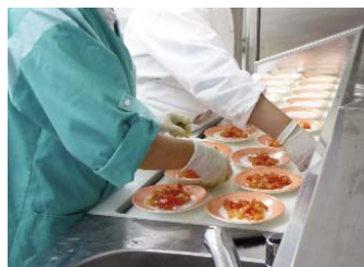
Table réfrigérée mobile : 1400 et 1800 mm fixe : 2300 mm