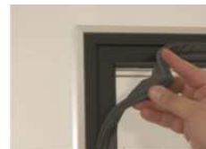
Joint magnétique amovible sans outils